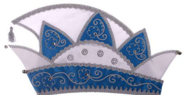
721 Atlas, Steine, Straß