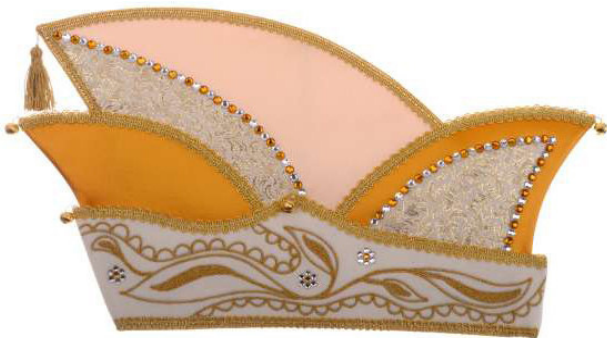
730 Samt/Brotat/260 Steine