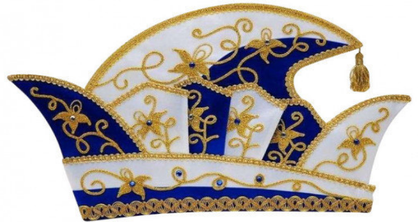
B 003 Kurbelstickerei, 24 Strasssteine