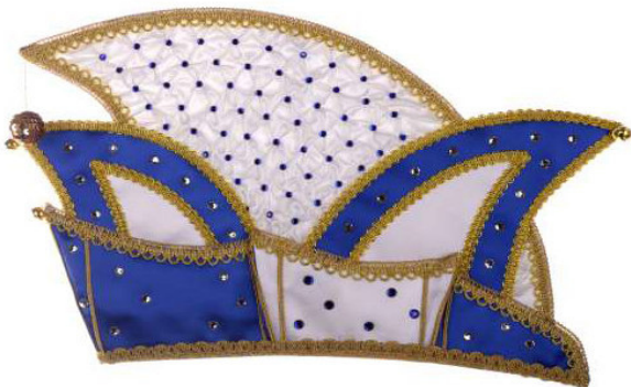
715 Atlas, Smok, ca. 190 Steine