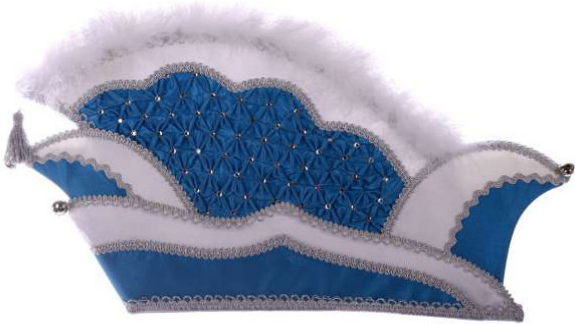
722 Atlas, Smok, ca. 112 Steine

Die Vielfalt an Stoffen und Farben, Stickerei und Straß finden Sie auf den Seiten 8039 (1-3).