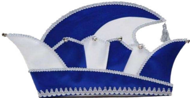
1127 11 Glöckchen