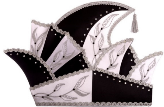
765 Atlas, ca. 110 Steine