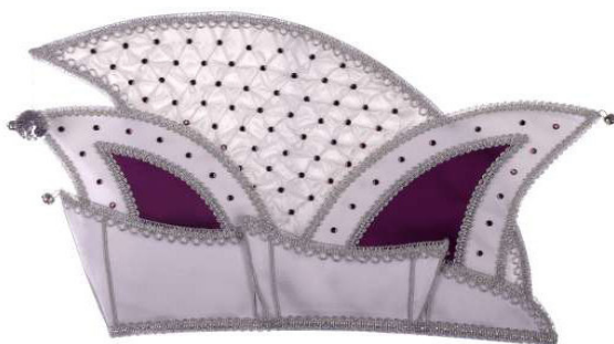
720 Atlas, Smok, ca. 166 Steine 589,00 €