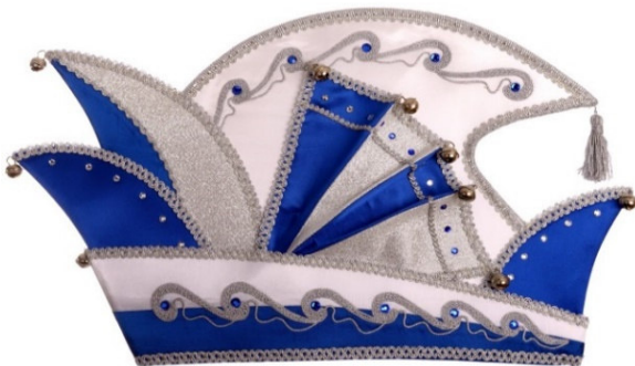
768 Atlas, Brokat, 54 Steine