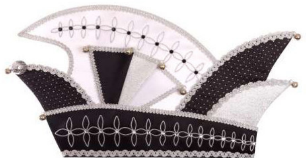
754 Atlas/Brotat/52 Steine