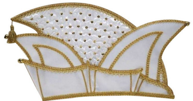
1069-2-S Mittelteil gesmukt mit Pailletten