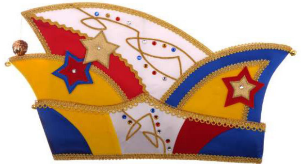
724 Atlas, 6 Sterne, 46 Steine