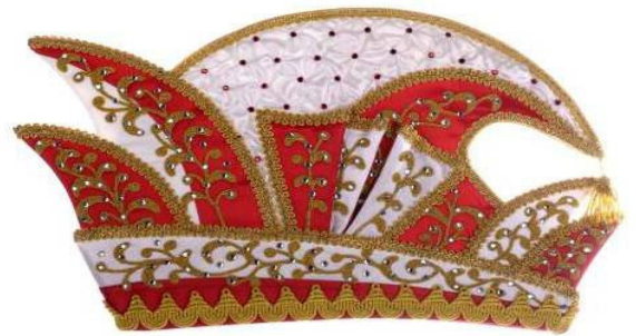
713 Atlas, Smok, Stickerei, 310 Steine