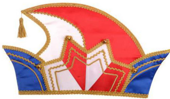
712 Satin, Borte, Glöckchen