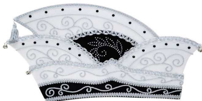
B 046 40 Strasssteine und 2 Strassmotive