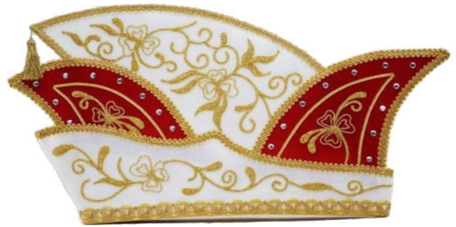
68438 Kurbelstickerei mit 40 Strasssteinen