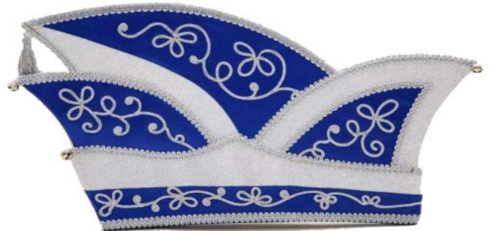
1132-B Brokatstoff mit Kurbelstickerei