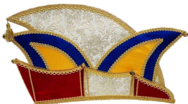
1069-2 B Brokatstoff, 3 Glöckchen