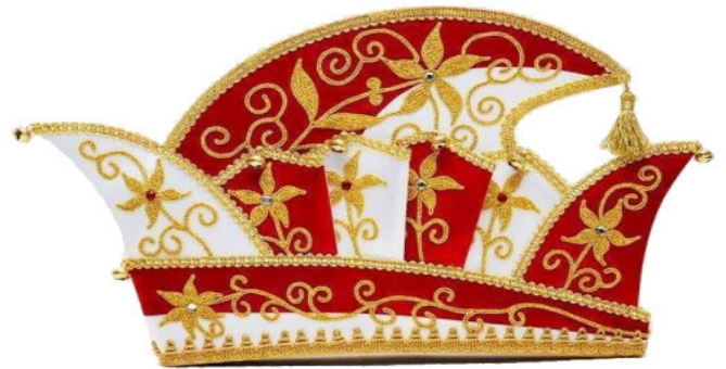
1128 Kurbelstickerei, 16 Strasssteine