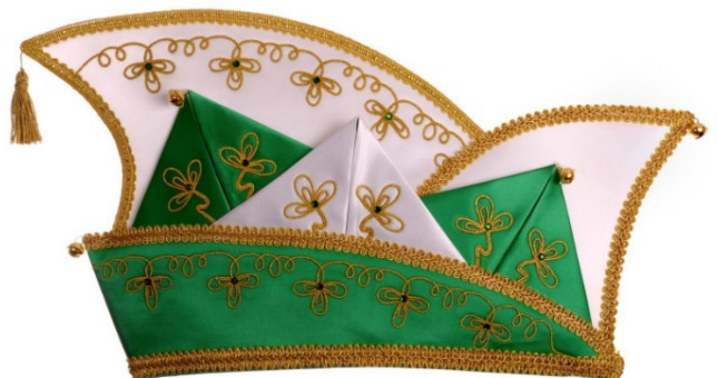
769 Atlas, Stickerei, 30 Steine