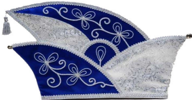
68249-B Brokatstoff mit Kurbelstickerei