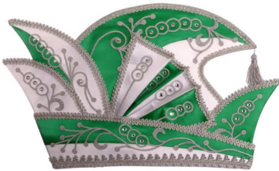
764 Atlas, 64 Straßsteine