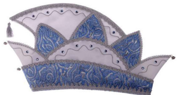
719 Atlas/Brokat, Steine