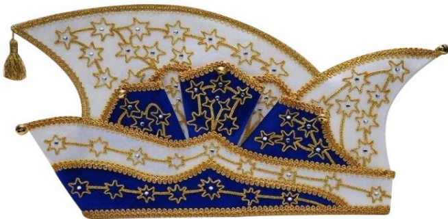
68440 Kurbelstickerei, 90 Strasssteine