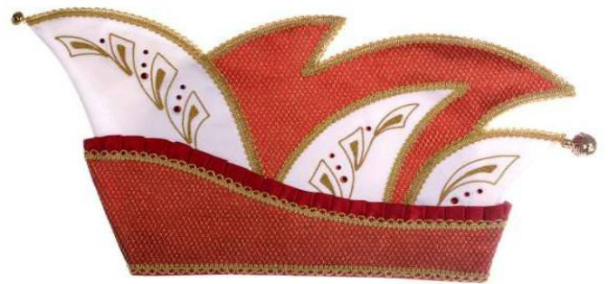
708 Brokat, Rüschen, Stickerei