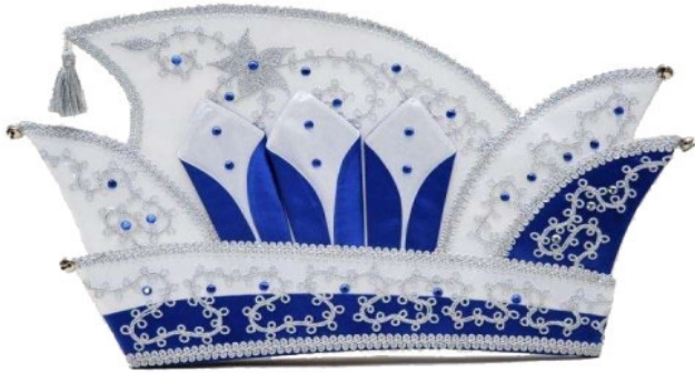
68448 Kurbelstickerei mit 60 Strasssteinen

Die Vielfalt an Stoffen und Farben, Stickerei und Straß finden Sie auf den Seiten 8039 (1-3).