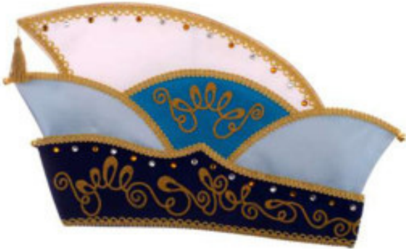
725 Atlas, ca. 56 Steine, Stickerei