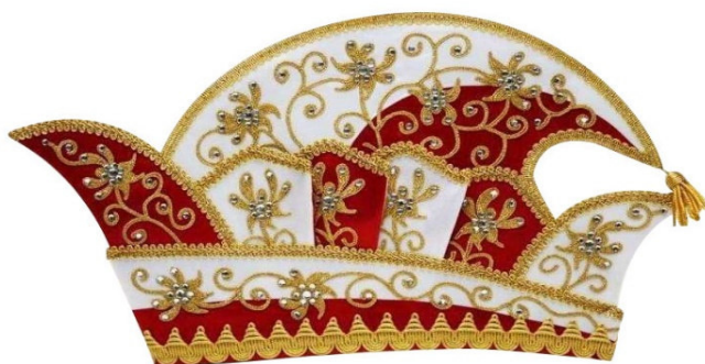
1150 Kurbelstickerei, mit 346 Straßsteinen