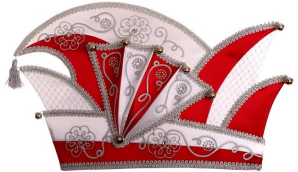
763 Atlas, Straßsteine- + motive