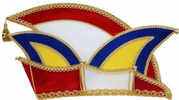
1069-6 3 Glöckchen

Die Vielfalt an Stoffen und Farben, Stickerei und Straß finden Sie auf den Seiten 8039 (1-3).