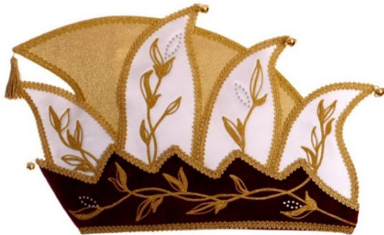
766 Atlas, Samt, Brokat, Steine