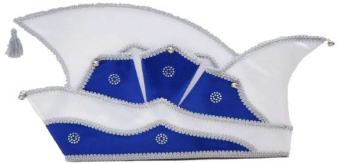
68443 10 Strassmotive