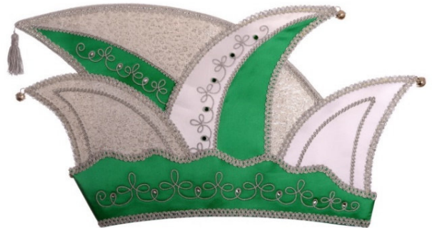
767 Atlas, Brokat, 32 Steine