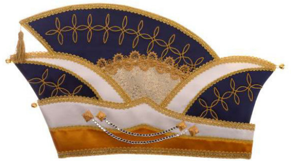
726 Atlas/Prägebrotat, Stickerei