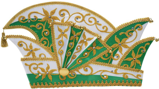
W313 Kurbelstickerei, 82 Strasssteine

Die Vielfalt an Stoffen und Farben, Stickerei und Straß finden Sie auf den Seiten 8039 (1-3).