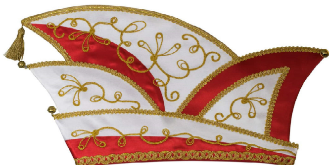
B 017 Kurbelstickerei