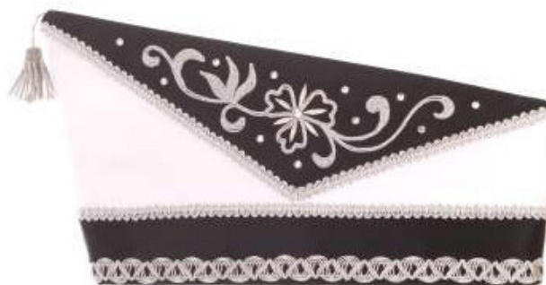
1047 - Kurbelstickerei und Steine