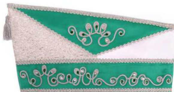
753 - Kurbelstickerei, Steine