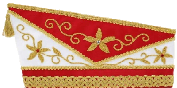
1010 - Kurbelstickerei und Steine