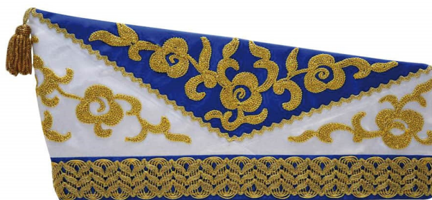
1012 - Kurbelstickerei