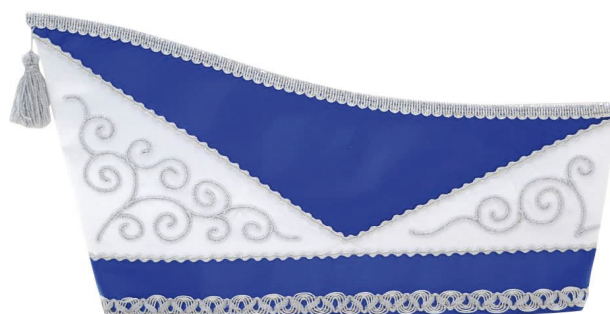
1046 - Kurbelstickerei