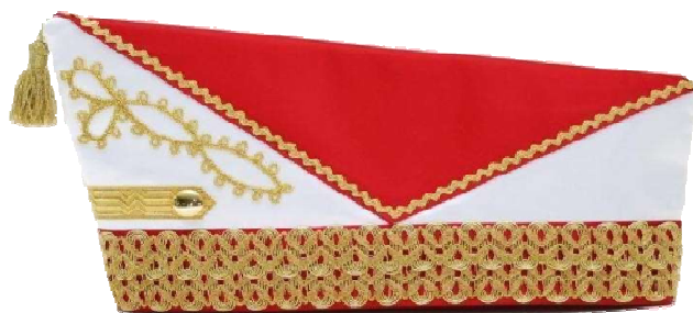
68123 - Kurbelstickerei und Riegel