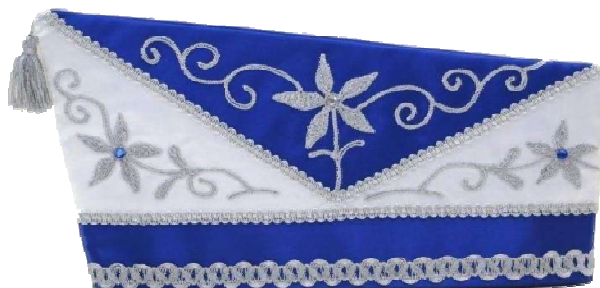
68092 - Kurbelstickerei u. Steine