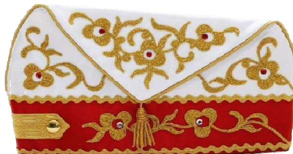
1048 - Jakobiner mit Stickerei