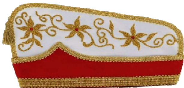
1034 - Kurbelstickerei und Steine