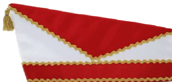
1040 - Schiffchen