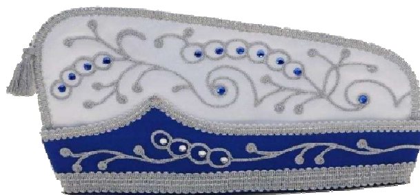
1035 - Kurbelstickerei und Steine