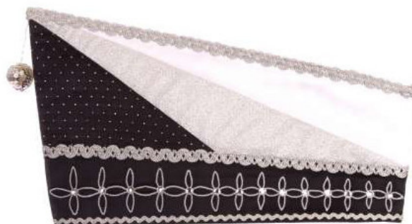
746 - Brokat/Atlas, 36 Steine