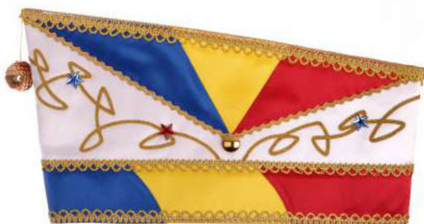
762 - Kurbelstickerei