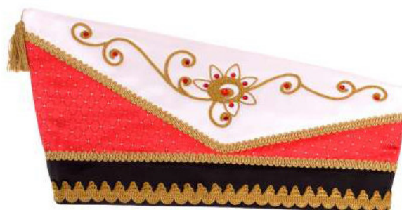
751 - Kurbelstickerei