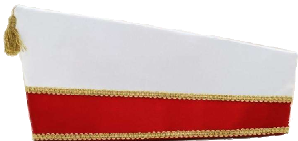
68038 - Schiffchen

Komiteemützen in feinsten Atlasseide. Die Materialfarben können Sie frei wählen. Gerne verarbeiten wir gegen geringen Aufpreis elegante Samt- oder Brokatstoffe. Monogramme, Schriftzüge oder Wappen machen die Mützen einzigartig.