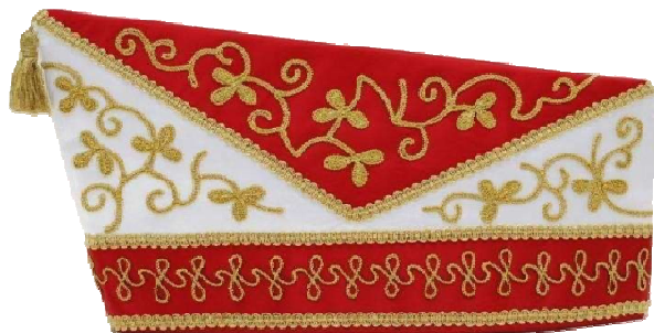
1011 - Kurbelstickerei