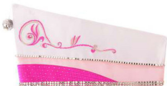
750 - Ausführung ohne Straß