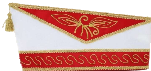
68070 - Kurbelstickerei