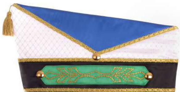
747 - Gitteratlas, Stick-Riegel

Komiteemützen in feinsten Atlasside. Die Materialfarben können Sie frei wählen. Gerne verarbeiten wir gegen geringen Aufpreis elegante Samt- oder Brokatstoffe. Monogramme, Schriftzüge oder Wappen machen die Mützen einzigartig.