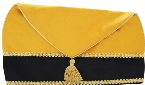
701 - Jakobiner