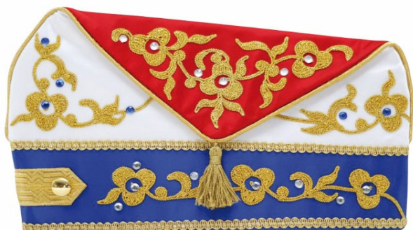
W 201 - Jakobiner mit Stickerei

Komiteemützen in feinsten Atlasside. Die Materialfarben können Sie frei wählen. Gerne verarbeiten wir gegen geringen Aufpreis elegante Samt- oder Brokatstoffe. Monogramme, Schriftzüge oder Wappen machen die Mützen einzigartig.