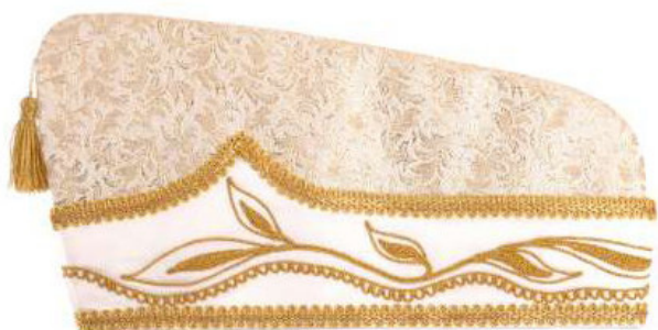
752 - Stickerei und Steine