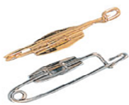
Sicherheitsnadel mit Platte