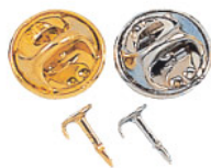
Butterfly-Verschuß Standard, inklusiv