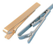
Krokodil mit Gelenk