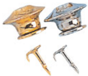
Dorn mit Sicherheitsverschuß