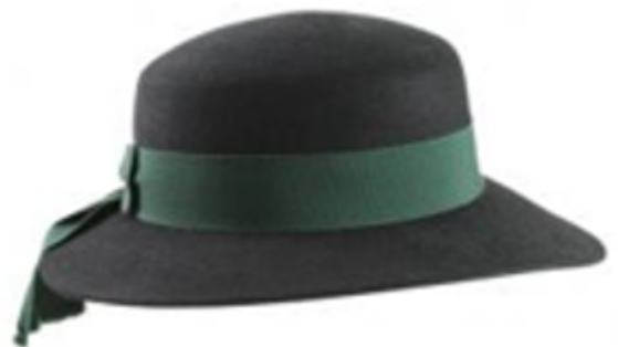
479 BU L66, Rand 7 cm, Gr. 54 - 61