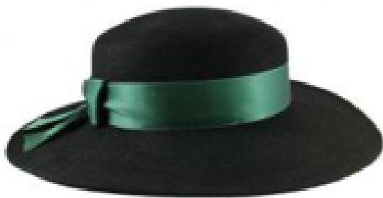
Lady L 665, Rand 9 cm, Gr. 54 - 61